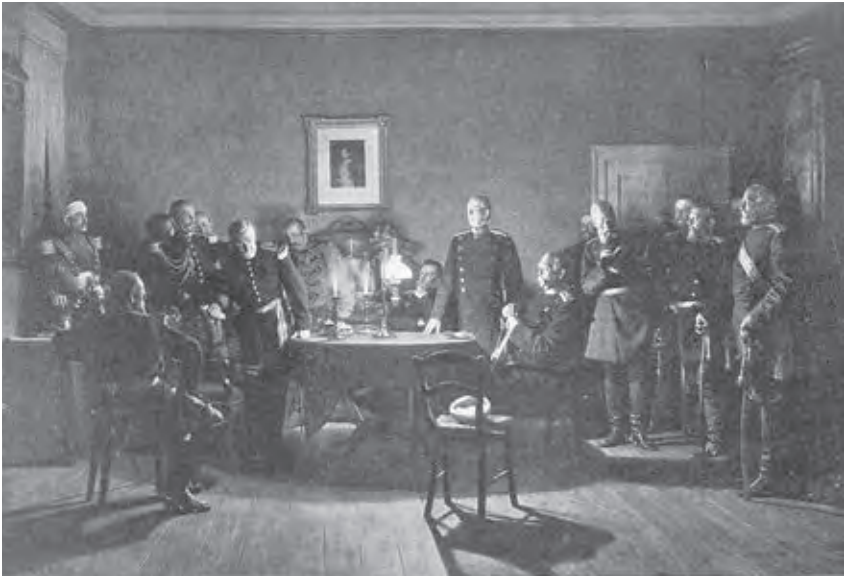
Ил. 4. А. фон Вернер. Переговоры о капитуляции в Доншери с 1 на 2 сентября 1870 года. Диорама. 1885. Холст, масло. 3,2х4,2 м. Александерплац, ротонда панорамы «Седан». Берлин

британского господства. В 1885 году в комплексе с панорамой Луи Брауна и Ганса Петерсена «Карательная экспедиция в Камерун» в Берлине была выставлена диорама «Прием короля Белла адмиралом Кнорром в Камеруне» 34 . В этом ряду необходимо упомянуть диорамный триптих (1884–1885) панорамного комплекса, посвященного битве под Седаном художника Антона фон Вернера. В этом триптихе – «Генерал Рейль вручает Вильгельму письмо от Наполеона III 1 сентября 1870 года», «Переговоры о капитуляции в Доншери с 1 на 2 сентября 1870 года», (ил. 4, 5), «Встреча Бисмарка с Наполеоном III 2 сентября 1870 года» (ил. 6) – изображались узловые эпизоды событий, окончательно решивших исход франко-прусской войны 1870 года и оказавших огромное влияние на дальнейшие судьбы Франции и Германии. Три вышеназванные диорамы представляли собой изогнутые полукруглые поверхности в нишах, не имели предметного плана, но при этом исключительно живописными средствами мастерски передавали иллюзию пространства и были безупречны с точки зрения соблюдения исторической точности 35 . Судя по сохранившимся описаниям и репродукциям, эти диорамы, экспонировавшиеся в комплексе с панорамами, относятся к типу «живописных» – то есть живописная часть в них главенствует. Предметные планы были решены сравнительно скупыми средствами, минимумом предметов,