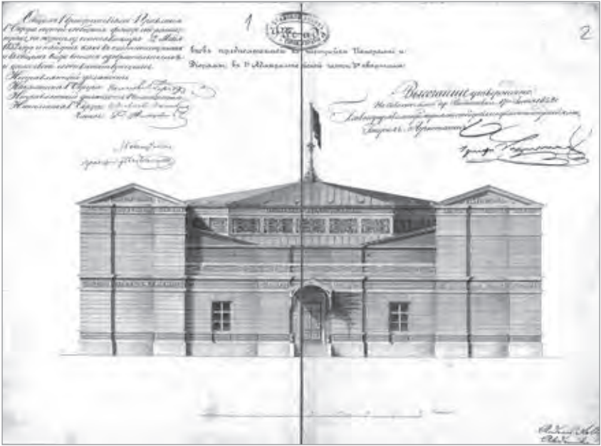
Ил. 1. Проект здания панорамы «Палермо» и двух диорам А.А. Роллера. 1852.

ции» и «Вид внутренности двора монастыря Санкт-Гроц» Андрея Роллера в 1-й Адмиралтейской части 3-го квартала российской столицы 12 . Была ли возведена эта постройка, выяснить пока не удалось.