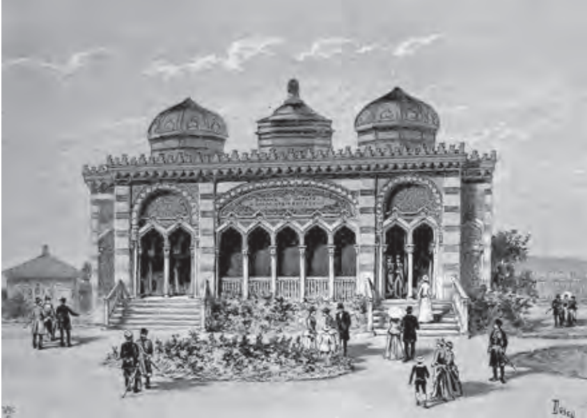
Ил. 8. Павильон диорамы Т. Пуальпо «Баку» на Французской выставке в Москве. 1891