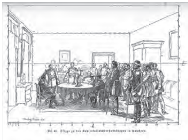
Ил. 5. А. фон Вернер. Переговоры о капитуляции в Донишери с 1 на 2 сентября 1870 года. Рисунок композиции диорамы