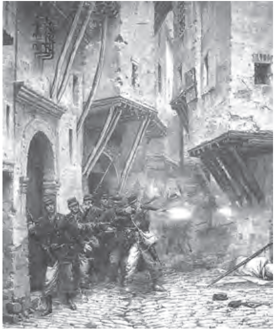
Ил. 3. Э. Детайль, А. де Невиль. Взятие Сфакса. Диорама. 1883. Париж

громады гор. Через суровые и дикие теснины свершают свой геройский переход русские солдаты. Стужа, голод и утомление обессилили не только людей, но и вычуженных животных: лошади и волы, выбившись из сил, едва втаскивают тяжелые орудия. Поддерживаемые сознанием своего высоконравственного долга и беззаветной любовью к отечеству, истомленные герои – русские воины, собрав последнюю энергию, помогают обессиленным животным и, вступив с неимоверными усилиями в отчаянную борьбу с са-