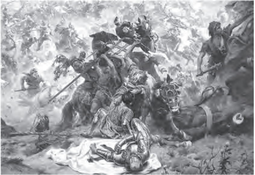
Ил. 12. Т. Попель, З. Розвадовский. Битва под Грюнвальдом. Диорама. 1910. Холст, масло. 5,5х10 м. Краков; Львов. Исторический музей

ского центра Украины (Киев). Впервые с 1941 года диорамы Рубо были представлены публике на выставке «Герои подземных сражений», проходившей в Севастопольской панораме в 2012 году 61 .