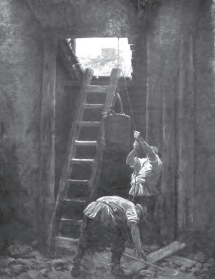
Ил. 13. Ф.А. Рубо. Работа минеров. Диорама. 1902–1904. Холст, масло. Музей героической обороны и освобождения Севастополя. Севастополь

1990-х годов искусство художественной диорамы получило наибольшее развитие, в этот период были созданы сотни произведений, многие из которых по праву признаны шедеврами этого вида изобразительного творчества. После некоторого спада, в силу происходивших в 1990 – начале 2000-х годов культурных, политических и социально-экономических процессов, сейчас мы можем вновь наблюдать массовый рост интереса к художественной диораме, в том числе выражающийся в том, что создаются новые произведения и реставрируются работы прошлых времен, появляются научные публикации.