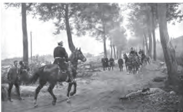
Ил. 6. А. фон Вернер. Встреча Бисмарка с Наполеоном III 2 сентября 1870 года. Диорама. 1884. Холст, масло. 3,8х6 м. Александерплац, ротонда панорамы «Седан». Берлин

не отвлекая внимания зрителя от происходящего на полотне, но одновременно работая на усиление ощущения реальности изображенного. Созданы эти диорамы прославленными в то время мастерами исторической, батальной и панорамной живописи.