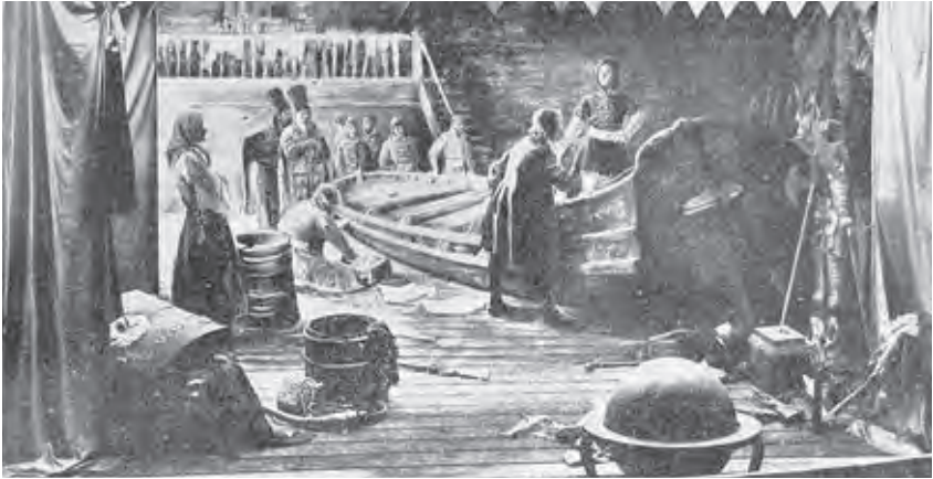
Ил. 10. В.М. Шульц, Н.К. Горенбург. Дедушка русского флота. Диорама. 1903. Летний сад. Санкт-Петербург; ротонда панорамы «Голгофа». Киев

В своих неопубликованных воспоминаниях Я.А. Чахров, тогда студент четвертого курса и староста репинской мастерской, вспоминает: «Илья Ефимович отнесся к этому сочувственно. Он пригласил меня к себе на совещание. Рассказал об этом срочном заказе. Выбрал из среды своих учеников наиболее зрелых и талантливых числом 14 человек на исполнение 7 картин-диорам. Размер диорам был установлен в 3,5 x 9 аршин. Меня просили взять заведование и организацию этой работы. Я собрал назначенных Ильей Ефимовичем товарищей, распределил