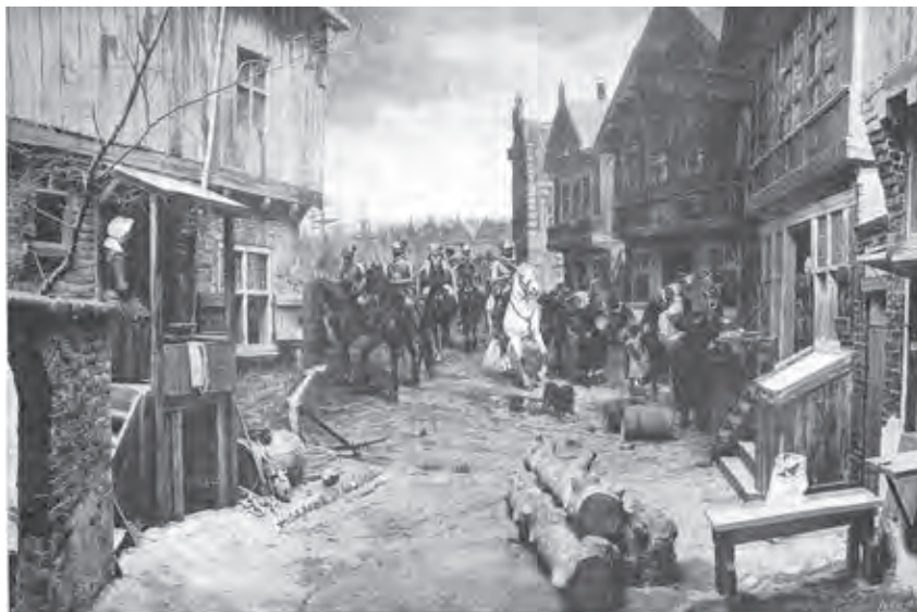
Ил. 2. Т. ван Эльвен. Выступление герцога Альбы из Амстердама в 1574 году. Диорама. 1880. Ротонда панорамы «Оборона Гарлема в 1573 году». Амстердам

ные эпизоды и итоги. Помимо чистой зрелищности, диорамы несли богатую зрительную информацию и, без сомнения, выполняли просветительские функции, являясь передовым масс-медийным инструментом того времени.